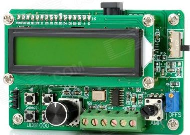
UDB-1000 DDS generátor signálu Mod. 10Vpp frequency od 0,01 Hz-2 MHz